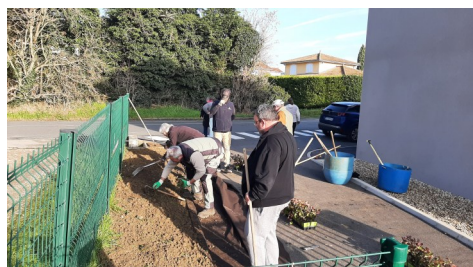
Brigade verte samedi 29 nov 2024